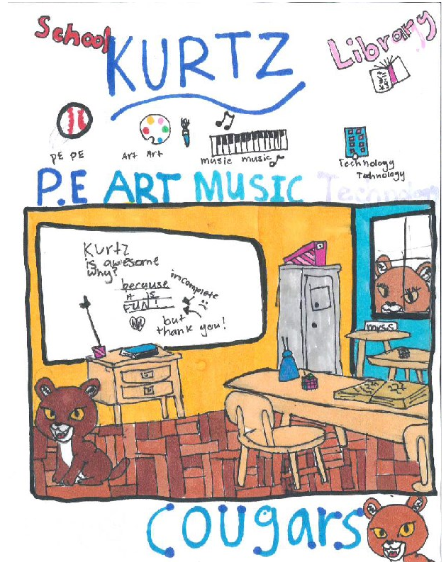
Bryn Bradley: 24/25 Student Planner Cover