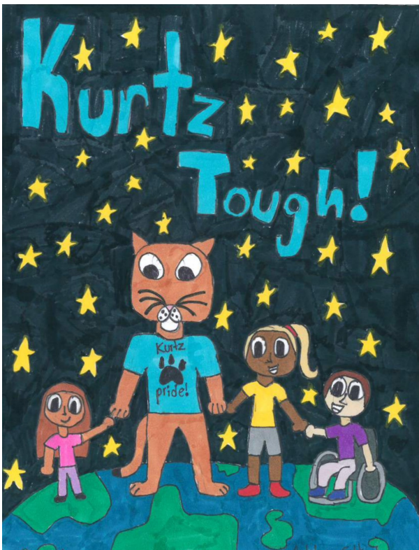
Adelynn Felt: 23/24 Yearbook Cover